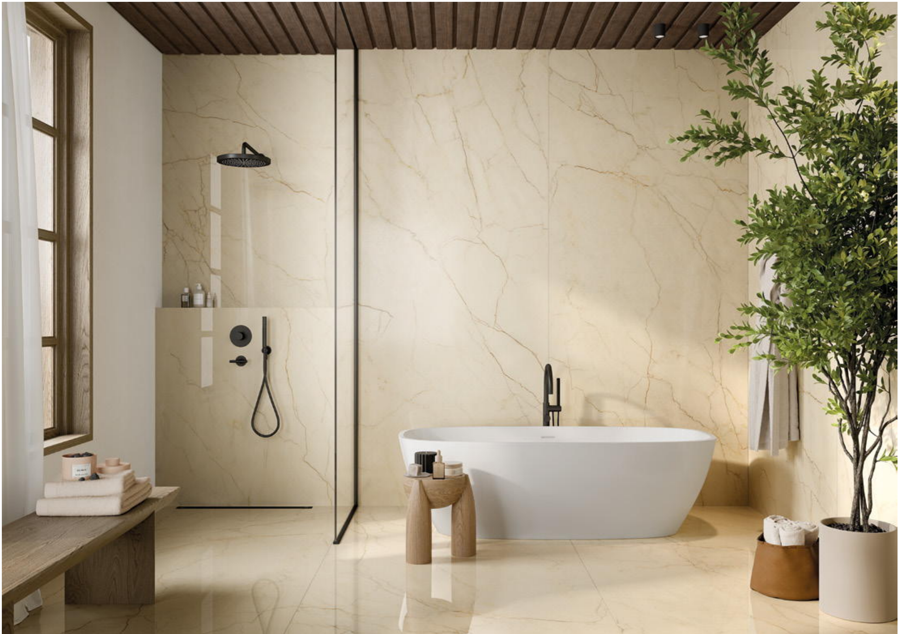
Wall & Floor AVORIO SEGESTA 120x280_48"x110" Lap Ret