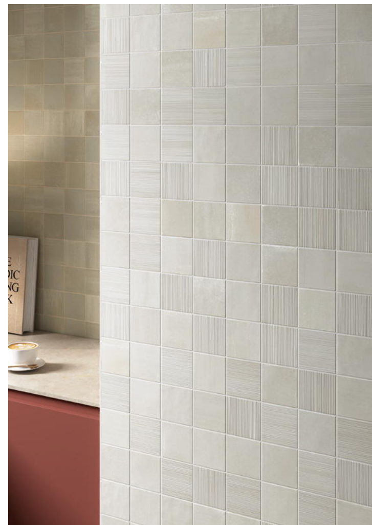
HIKARI ALMOND + DECOR ALMOND 10x10 cm / 4"x4"