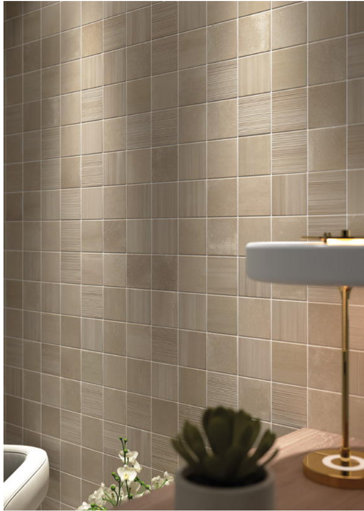
HIKARI CLAY + DECOR CLAY 10x10 cm / 4"x4"