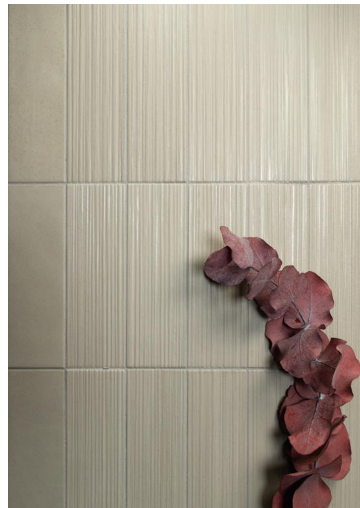
HIKARI EVERGREEN + DECOR EVERGREEN 6x18,6 cm / 25"x7,5"