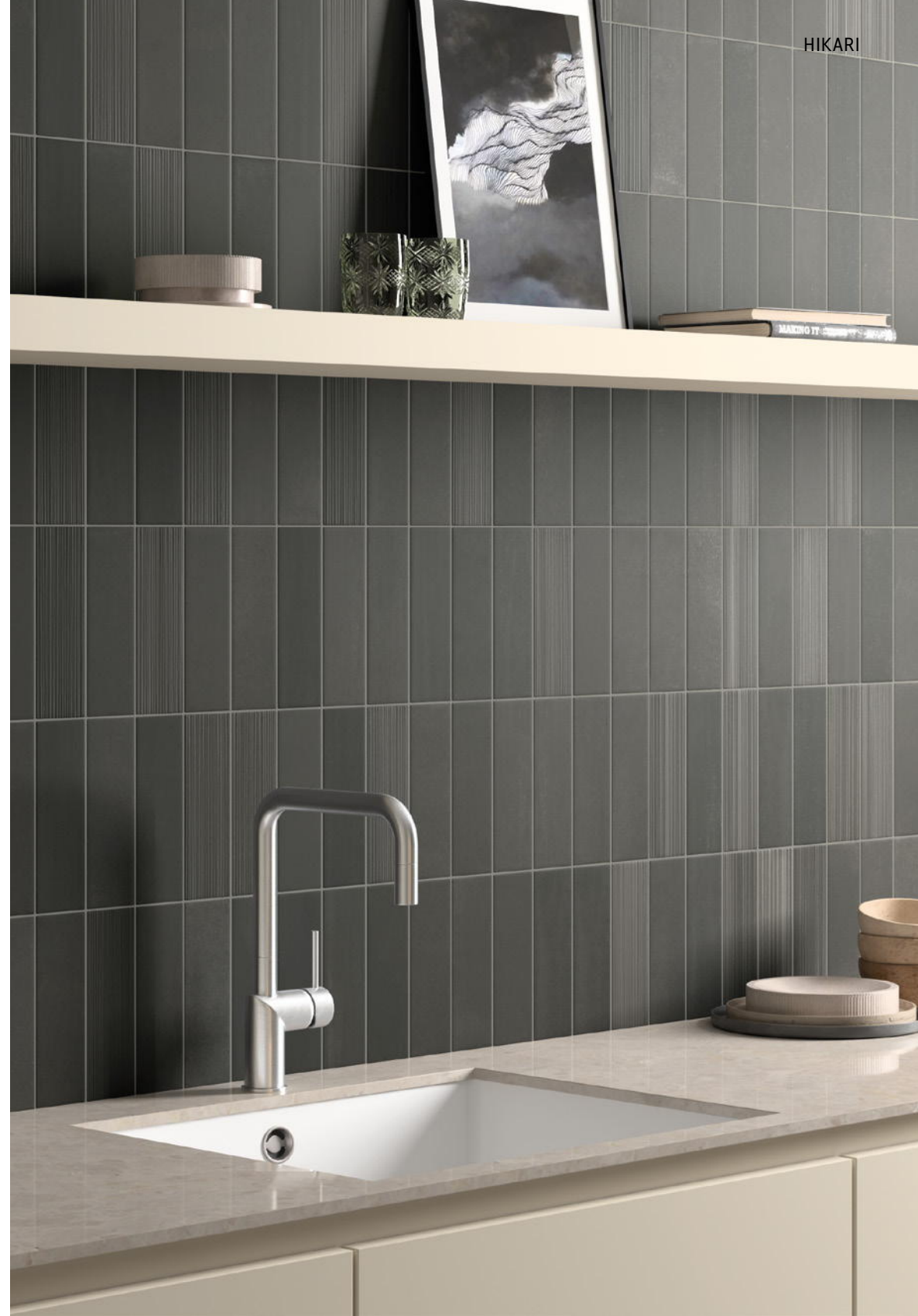
HIKARI EBONY + DECOR EBONY 6x18,6 cm / 2,5"x7,5"