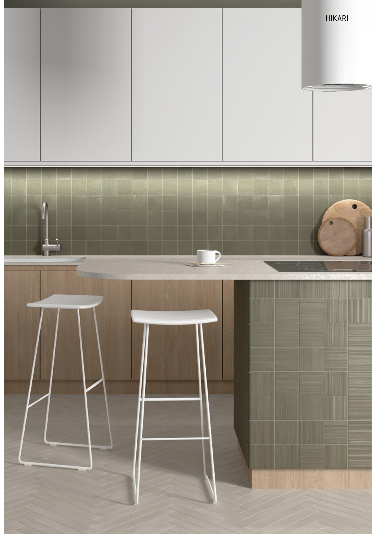
HIKARI SAGE + DECOR SAGE 10x10 cm / 4"x4"