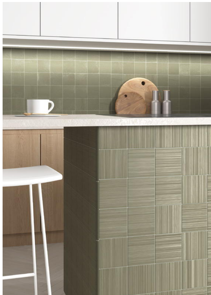
HIKARI SAGE + DECOR SAGE 10x10 cm / 4"x4"