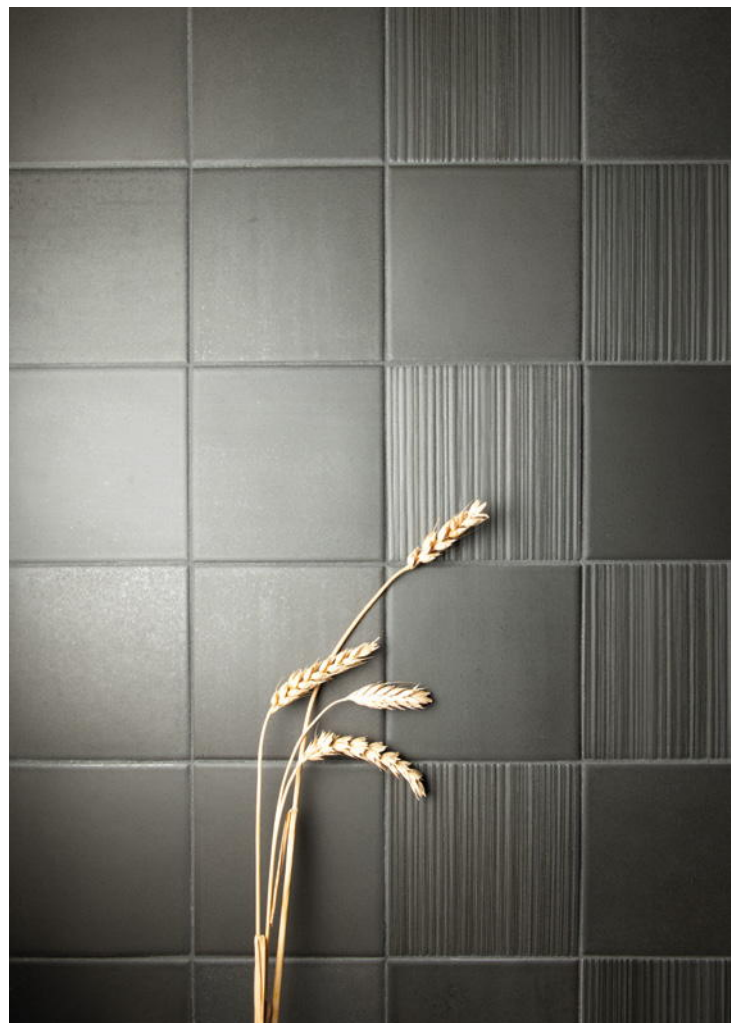
HIKARI EBONY + DECOR EBONY 10x10 cm / 4"x4"